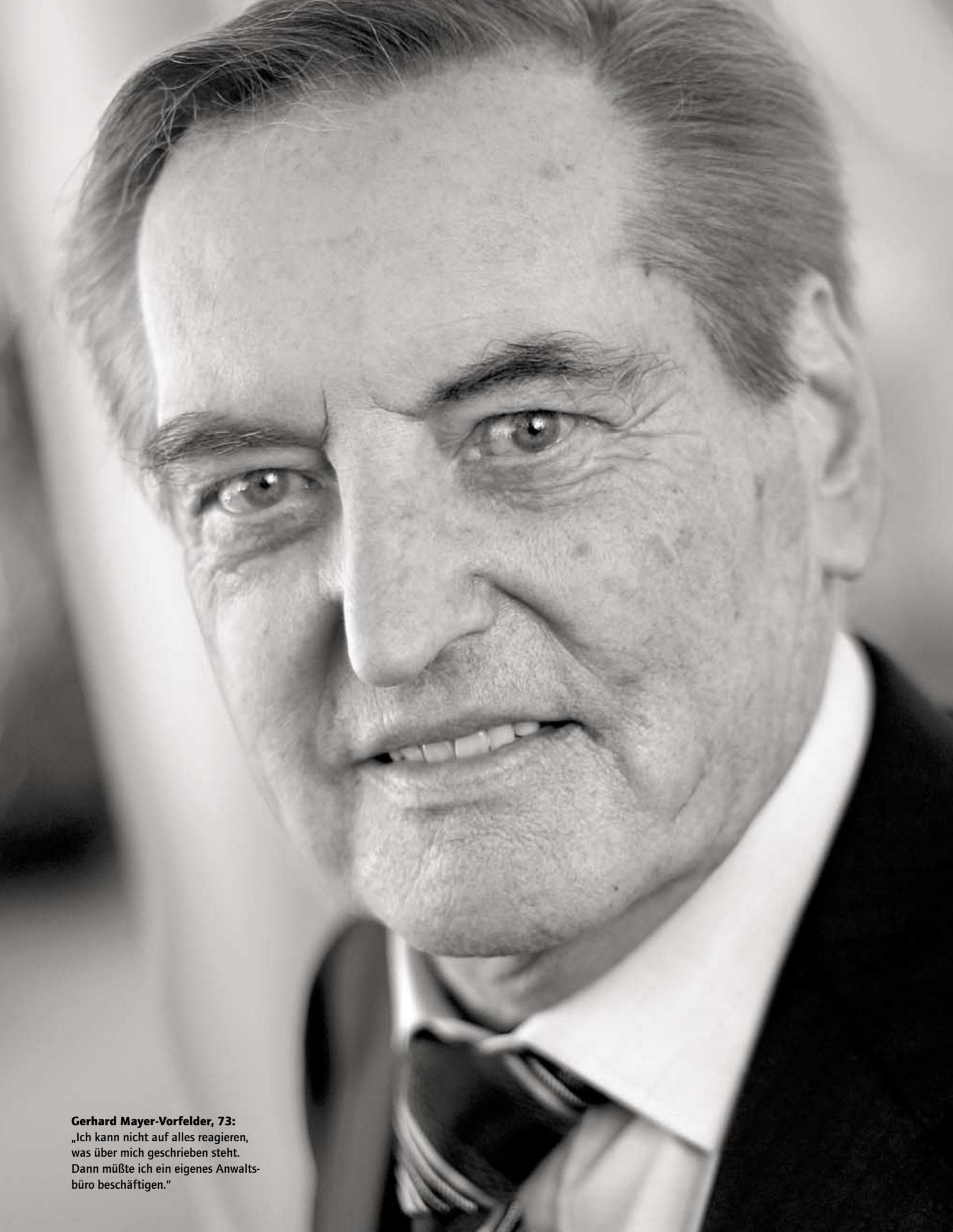
Gerhard Mayer-Vorfelder, 73: „Ich kann nicht auf alles reagieren, was über mich geschrieben steht. Dann müßte ich ein eigenes Anwalts- büro beschäftigen.“